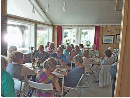
Stua var full