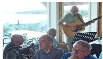
Og det var litt musikk