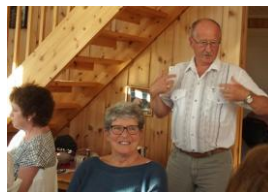
Audun hadde historier