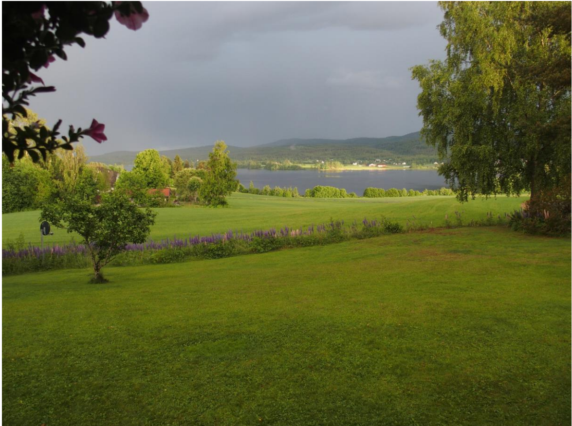
Tåfedis over Sandsjøen

XXXXXXXXXXXXXXXXXXXXXXXXXXXXXXXXXXXXXXXXXXXXXXXXXXXXXXXXXXXXXXXXXXXXXXXXXXXXXXXXXXXXXXXXXXXXXXXXXXXXXXXXXXXXXXXXXXXXXXXX