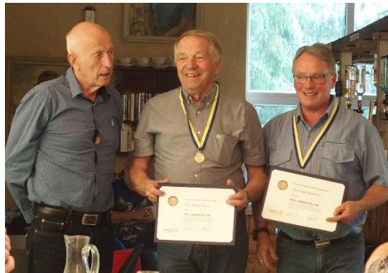
Utdeling av Paul Harris Fellow utmerkelse