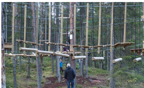
Noen av utfordringene