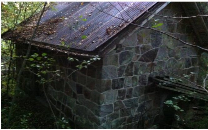
Den gamle kraftstasjonen