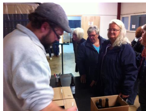
Ølsalget gikk bra